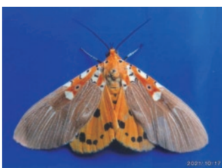
イチジクヒトリモドキ

下の写真は外灯に寄ってきた蛾とバッタや、家の前の川にやってきたトンボです。身近な生物も写真の撮り方でこんなに綺麗に見えるんですね。又、写真見せて下さい。(専務)