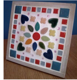
ご協力：我谷タイルさん LIXILさん