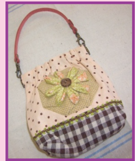
袋だけの大きさ 14cm x 15cm

日 時：3月17日(土)PM1時半から3時頃まで 会 場：当社2F 材 料 費：800円 持 ち 物：針・糸切りはさみ 講 師：さふらん工房(坂井市春江町針原) 土田優子先生