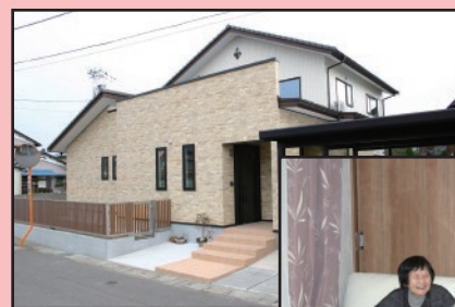
線路に面した H様宅