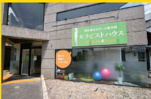
嶺北縦貫線沿いのお店。駐車場完備